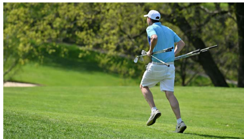
Honba za handicapem bývá nezdravá

Ne, na hřištích se neženili čerti, jak je ostatně patrné z výsledků profesionálů. To jen má leckdo po čertovsku vyrobený handicap.