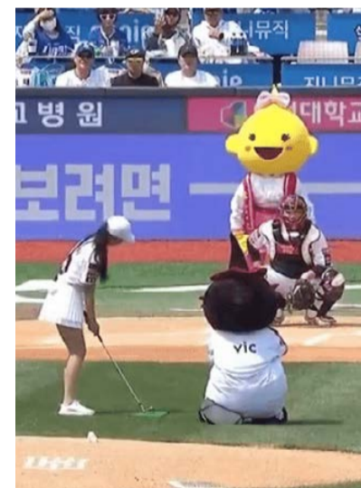
Čelem k masám? V Japonsku se prezentoval golf na baseballu.

Podle francouzského L'Humanité má být příčinou stále náročnější zaměstnání lidí, kteří tak nemají čas na své záliby. Svě hraji i společenské změny. Z „bílého“ sportu se díky Tigeru Woodsovi sice stala multietnická záležitost, ale mladí Američané nacházejí hrdiny jinde. Především americký fotbal i basketbal jsou plné příběhů, jak chudí k bohatství a slávě přišli.