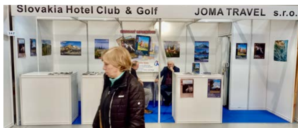
Jediná golfová stopa na letošním Holiday World

firmě Ragusa rostla každým rokem. Byla pořádána v Erpetu, na Strahově, zpátky ve Veletržním paláci a v Letňanech. Její vrchol viděli návštěvníci v roce 2009, kdy se opět ve Veletržním paláci představilo 125 vystavovatelů. V té době ovšem začínala i ekonomická krize.