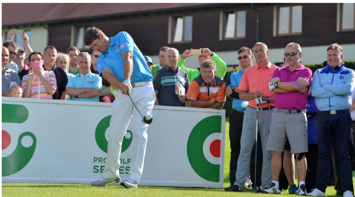
Akce, která už také není: exhibice Canon Pro Golf Series, zde na Dýšině vítěz čtyř turnajů kategorie major Padraig Harrington