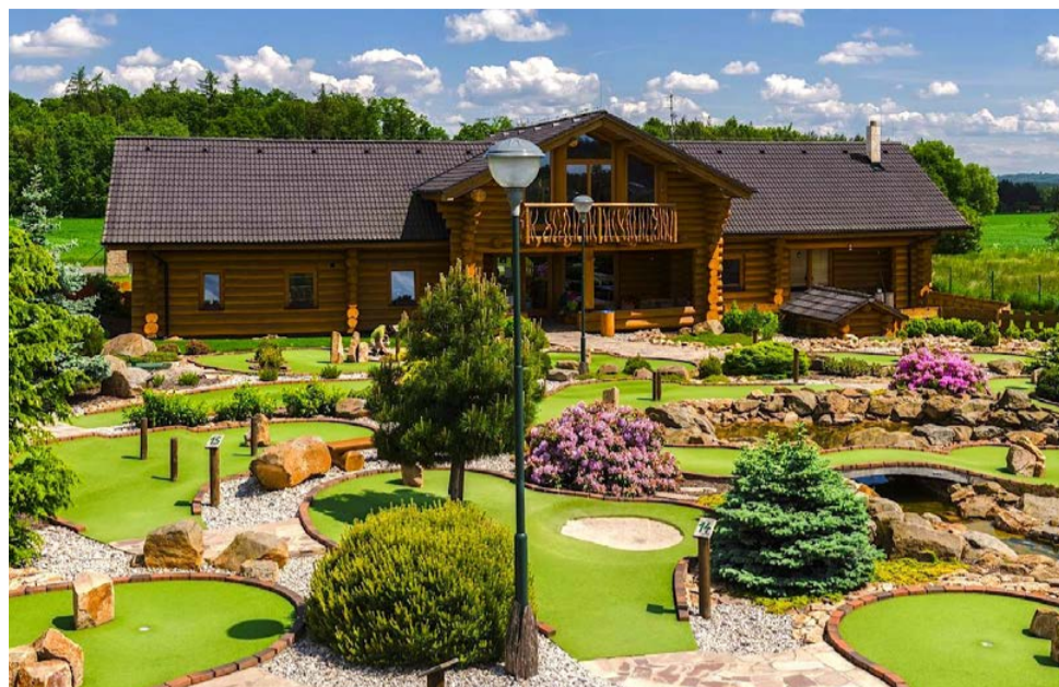
Adventure Golf Horní Bezděkov

Jsou rozdílné, a přesto mají mnoho společného. Dva areály na adventure minigolf nabízejí příležitost ke zlepšení puttování i golfování. Ohrnujete nos? Zkuste vylepšit zdejší neuvěřitelné rekordy.