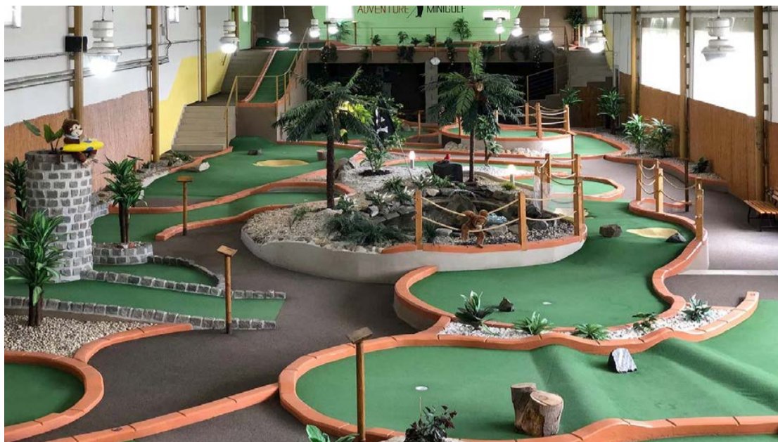
Adventure Minigolf Kunratice