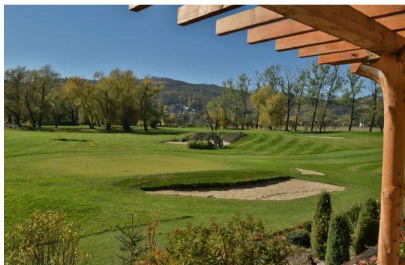
Vyplávané Albrechtice musely skončit

„Rodiče hřiště drželi nad vodou a financovali ho z důchodu. Nových sousedů ale už měli plné zuby, rezignovali a hřiště zavřeli. Byl to hořký