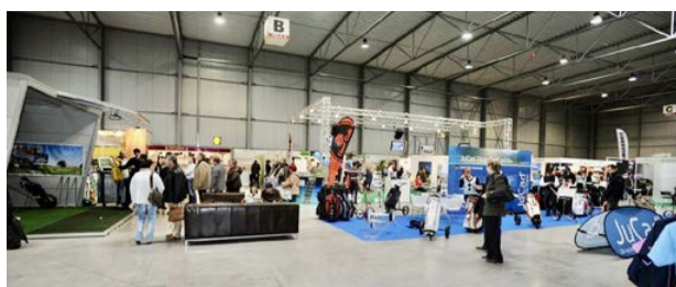
Golf Show v dobách plného lesku