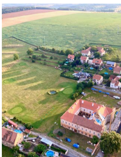
Golf Prštice

pár dní do nich vrací život. Od 11. do 21. května naposledy navštíví také halu Erpet na Smíchově. Slovo naposledy je tady důležité. Erpet centrum se totiž začne po čtyřech letech od požáru bourat, aby uvolnilo místo developerskému projektu Šemíkův břeh. Památka na čtvrtstoletí indoorového golfu tak definitivně zmizí.