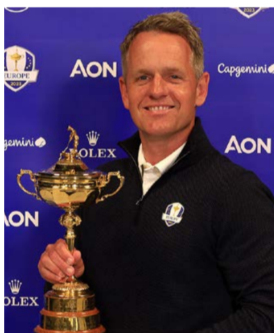
Luke Donald

Luke Donald, který byl v letech 2011–12 po 56 týdnů světovou jedničkou, ačkoli nikdy nevyhrál turnaj kategorie major, si poprvé zahrál na českém hřišti. Angličan potvrdil svou účast na D+D Real Czech Masters na Albatrossu.