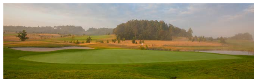
Loreta Golf Pyšely