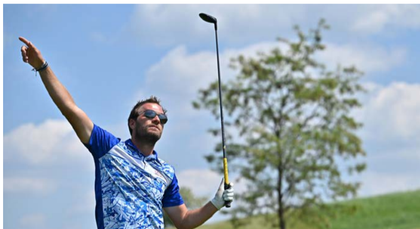
Kam až zamíří loňský nejlepší profesionál?

Jsem spokojen. Stojí mě to sice víc času, ale mám zodpovědnost sám za sebe. Taky je to nová motivace, víc pracovat se sponzory, být aktivní. Jsem rád, že i v téhle těžké době za mnou stojí a podporují mě. Tři roky jsem přemýšlel, jestli má smysl v golfu pokračovat. Zažil jsem spoustu nepříjemností, ale za největší úspěch beru, že jsem se dokázal z toho dostat. I ty dva tituly Golfisty roku mě nakoply. Vážím si vítězství v hlasování expertů i veřejnosti. Je to hnací motor.